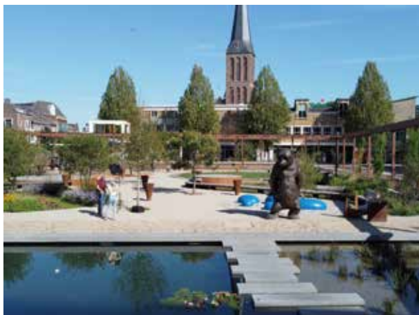
De pleinen van Hengelo (links) en Ede (rechts)

Pleinen zijn van oudsher dé plekken waar mensen om allerlei redenen samenkomen. Hier wordt letterlijk ruimte geboden aan uiteenlopende activiteiten. Op pleinen vinden (jaarlijks) belangrijke gebeurtenissen plaats, zoals Koningsdag, uiteenlopende muziek-evenementen en de kermis. Mede daarom is het van belang dat allerlei (doel)groepen hier op een prettige manier kunnen verblijven. Helemaal nu centra steeds meer veranderen in ‘places to be’ en ‘places to meet’. Voldoende verblijfskwaliteit begint met de aanwezigheid van goede openbare, commerciële en integrale zitgelegenheden. Dat dit een positief effect heeft op de verblijfsduur van bezoekers blijkt inmiddels uit meerdere (wetenschappelijke) onderzoeken 2 . Ook speelgelegenheden, openbaar groen, water(elementen) en kunstwerken kunnen de verblijfsduur van bezoekers verlengen. Het Marktplaatsplein in Hengelo is hiervan een