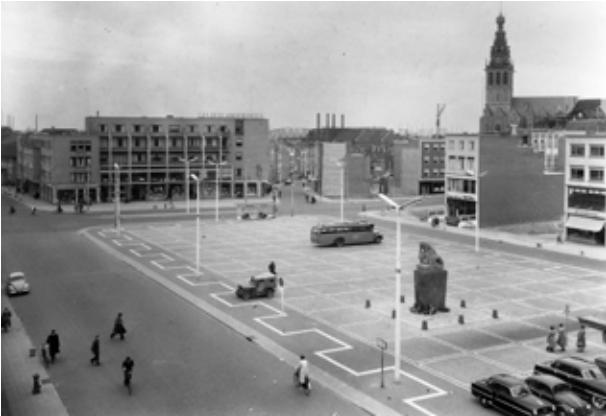
Plein 1944 Nijmegen, oud